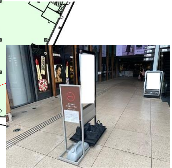
B ホール専用 B1ポスタースタンド（両面）