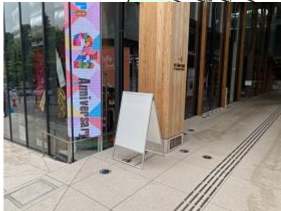
C LIFORK専用 B1ポスタースタンド