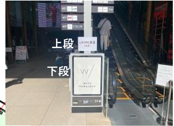
A 上段：LIFORK専用 A3サイン 下段：ホール専用 A1ポスター（両面）